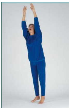
11 Le patient essaie d'attraper un objet qui serait au plafond