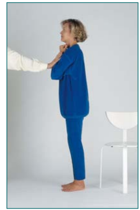
7 Capacité à résister à 3 poussées successives en arrière, les coudes joints sur le sternum