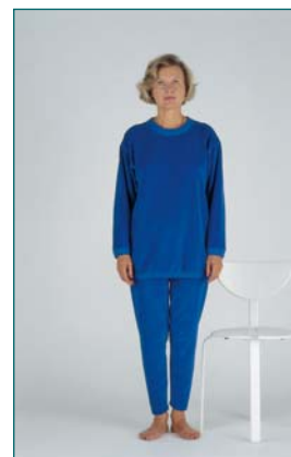
4 Équilibre debout, les yeux ouverts , les pieds joints