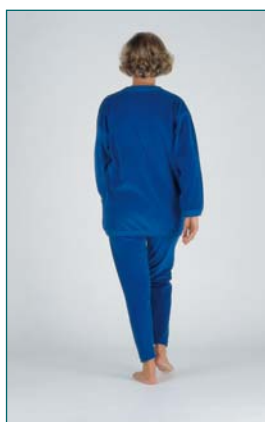
8 Évaluation de la stabilité du tronc