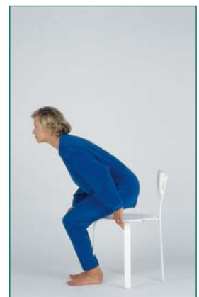
13 Évaluation de l'équilibre lorsque le patient se rassied