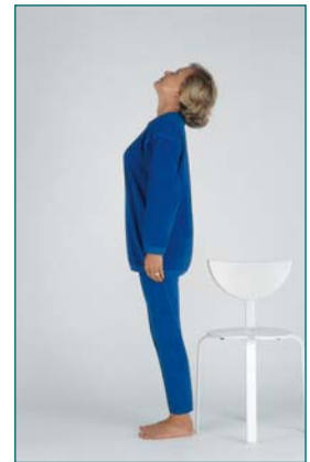
10 Équilibre en hyperextension de la tête en arrière