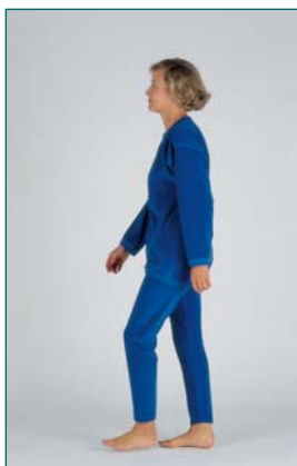
1 Début, initiation de la marche

Pour chacun des 9 paramètres étudiés, la marche est notée normale (1), ou anormale (2).