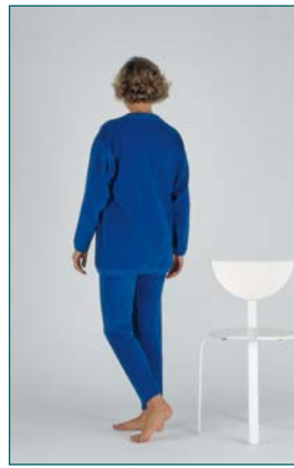
6 le patient effectue un tour complet sur lui-même