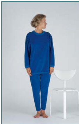
8 Équilibre après avoir tourné la tête à droite et à gauche