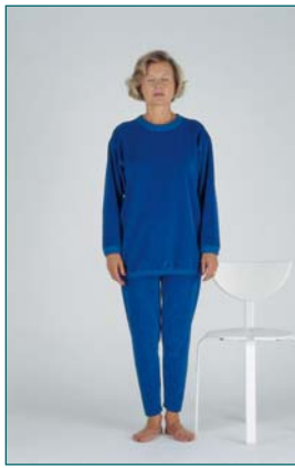
5 Équilibre debout, les yeux fermés, les pieds joints