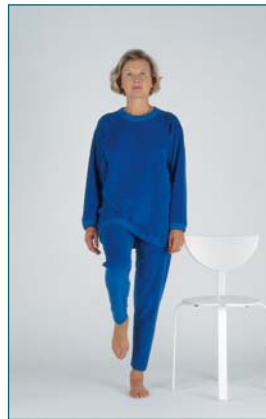
9 Debout en équilibre sur une seule jambe, pendant plus de 5 secondes