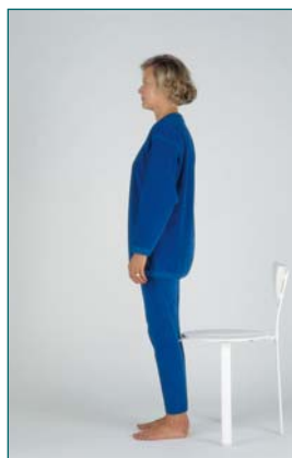
3 Équilibre debout juste après s'être levé