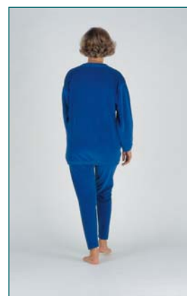
9 Évaluation de l' espacement des pieds lors de la marche