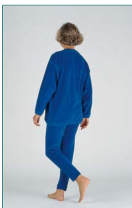
7 Exécution d'un virage tout en marchant