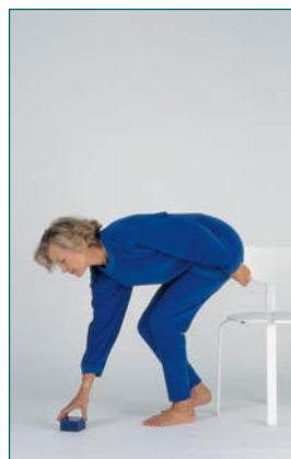
12 Le patient ramasse un objet devant lui