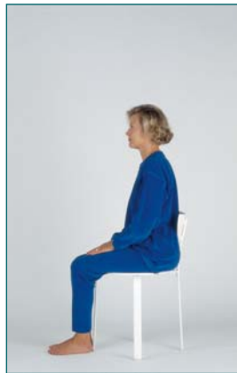
1 Équilibre, assis droit sur une chaise

Pour chacun des 13 tests, l'équilibre est noté (1), partiellement compensé (2), franchement anormal (3).