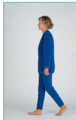
3 Évaluation de la longueur du pas (à droite et à gauche)