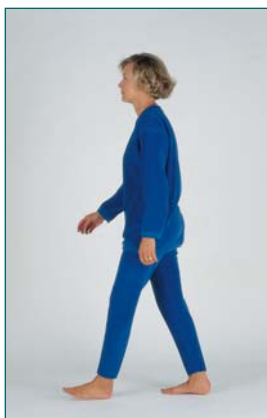
4 Évaluation de la symétrie du pas (entre droite et gauche)