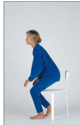
2 Le patient se lève (si possible, sans aide des bras).